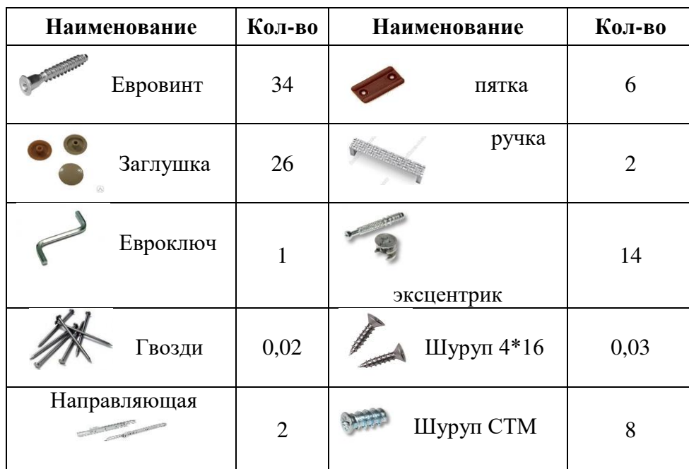
Таблица комплектации деталей