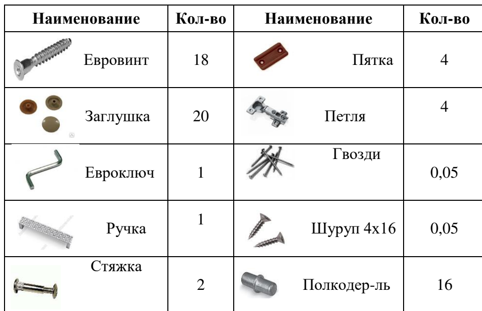
Таблица комплектации деталей