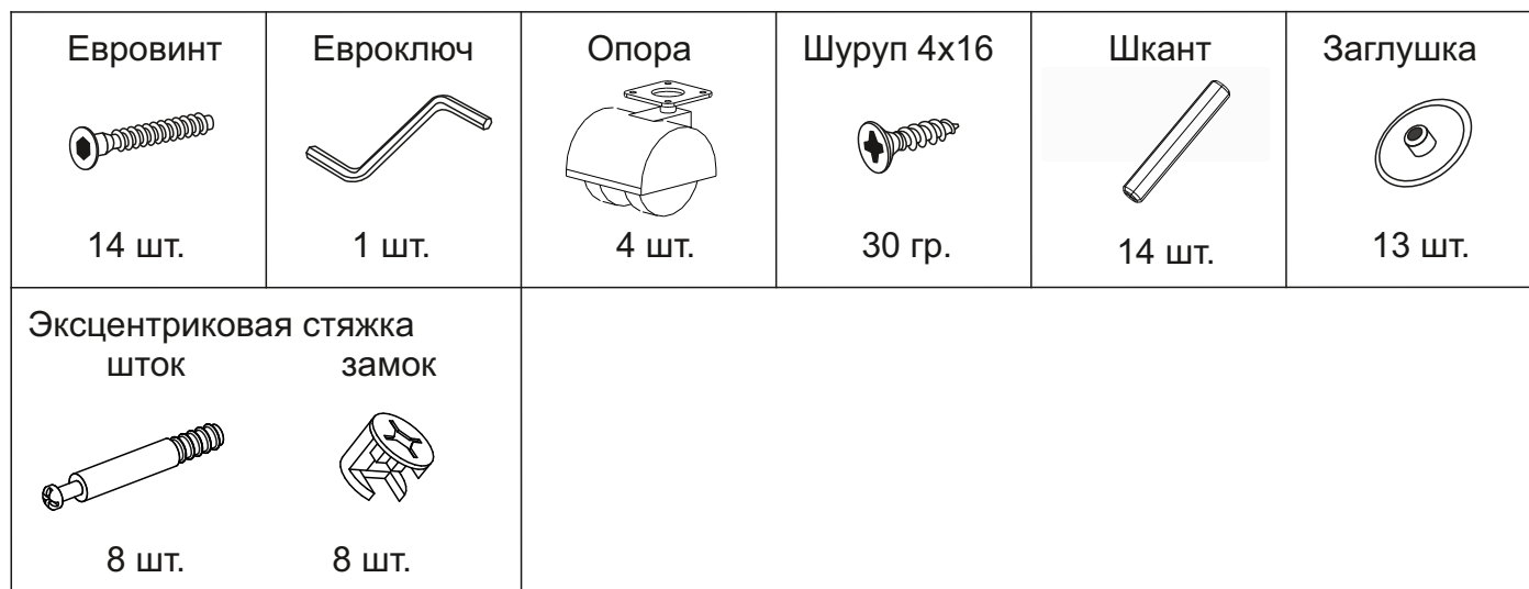
Таблица комплектности фурнитуры